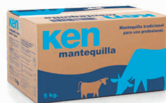
KEN MANTEQUILLA EN BLOQUE

La mantequilla se obtiene por el batido de la nata.