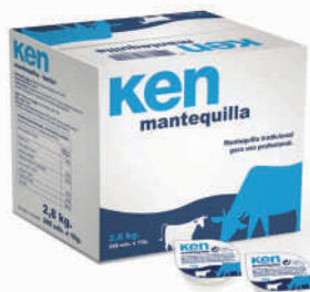
KEN MANTEQUILLA EN MICROTARRINA