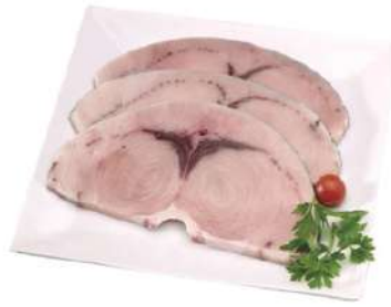
Rodaja pez espada