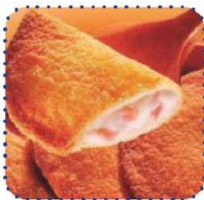
Delicias artesanas Jamón y Queso