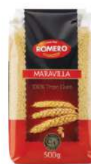
Pasta maravilla B/ 5 kg.