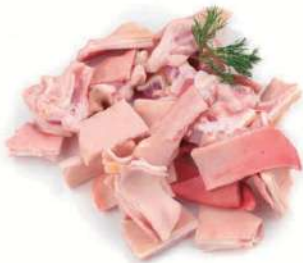
Oreja cocida troc.