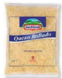
Rallado gratinar C/ 8x1kg.