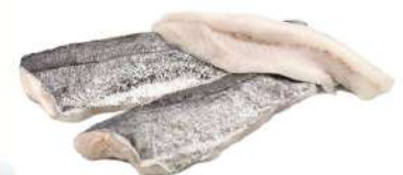
Filete merluza c/p 8/10 y 6/8