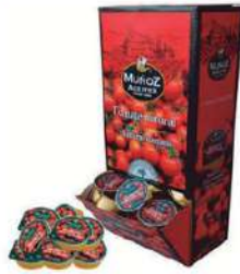
Tomate nat. Tarr. C/ 100x22gr