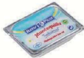
Mantequilla porc. C/100x10gr