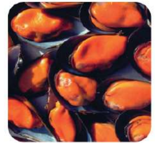
Mejillon m/c 40/60