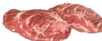
Carrillera interna de cerdo