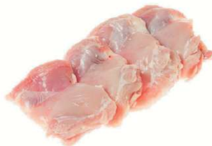
Filetes de pollo de contramuslo