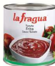
Tomate frito extra C/ 6x3 kg.