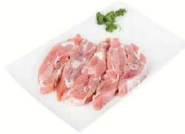
Chuleta pavo ajillo