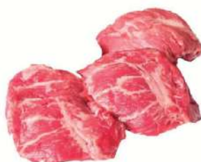
Carrillera externa de cerdo