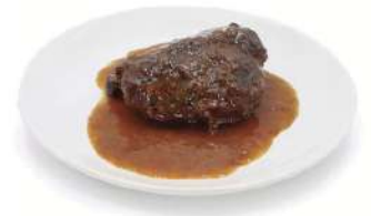
Carrillera cerdo al vino