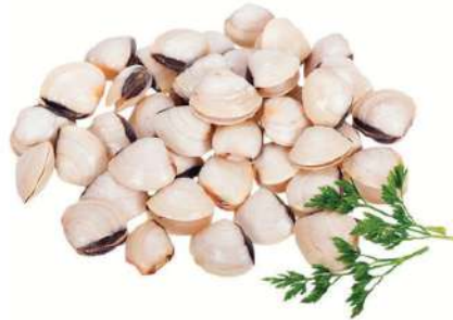
Almeja blanca 60/80