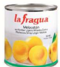
Lata melocoton alm 30/40 C/ 6x3 kg.