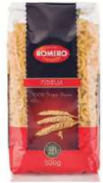
Pasta fideua B/ 5 kg.