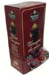
Vinagre de vino C/ 168x10 ml