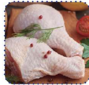
Jamoncitos pavo nac.