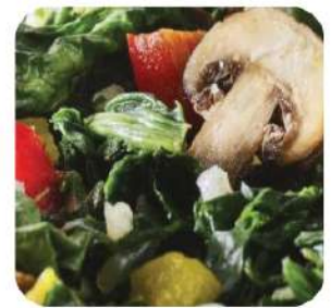
Salteado espinacas, pimiento y champiñón