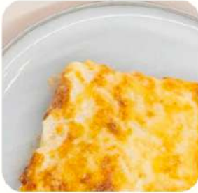
Canelón pollo corral