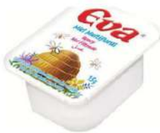
Miel porc. C/ 110x15 gr.