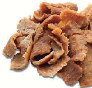
Loncheado ternera Clavo