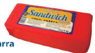
Queso barra sandw. C/ 2x3,3 kg.