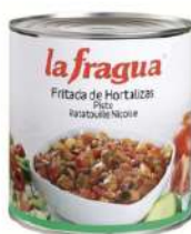
Fritada hort. Esp.(Pisto) C/ 6x3kg.