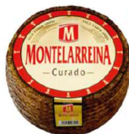
Queso señorío Montelarreina