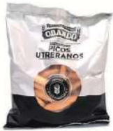
Picos utrerranos C/ 100x20 gr.