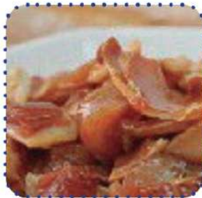
Oreja cocida troc adob.