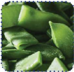
Judia v. Plana