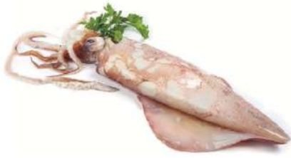
Calamar potera 3p 250gr aprox/und (14/16 cms)