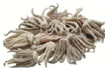
Rejos pota limpio