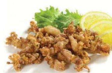
Puntilla enharinada Clavo