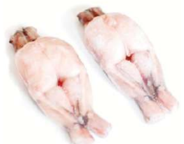
Ancas de rana 21/25