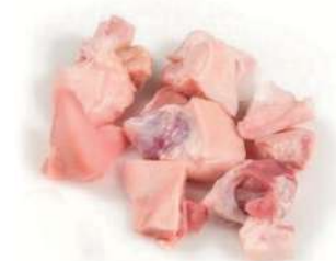
Morro cocido troc.