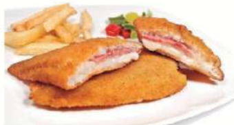
Mini cachopo pollo fiambre y queso