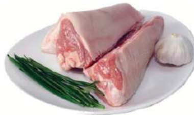
Codillo salm. Avimaher