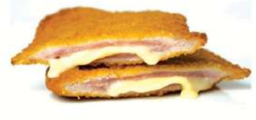
Milanesa lomo de cerdo