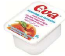
Mermelada porc. melocotón C/ 80x20 gr.