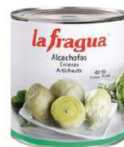
Alcachofa ent.30-40 C/ 6x3 kg.