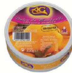
Dulce membrillo porc. C/ 18x16 un