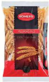
Pasta macarron n°3 B/ 5 kg.