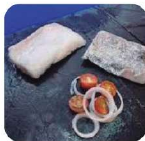
Supremas bacalao 100/150