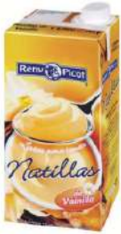
Natillas vainilla C/ 6x1l.