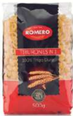
Pasta tiburones B/ 5 kg.