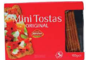
Melba mini tosta C/ 28x100 gr.