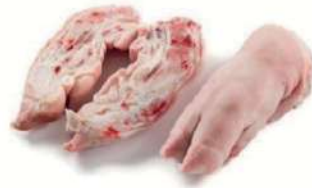
Manitas cerdo 1/2