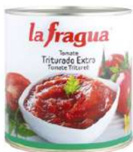
Tomate triturado C/ 6x3 kg.