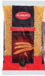
Pasta fideo cabellin B/ 5 kg.