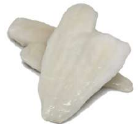
Filete limanda 120/170