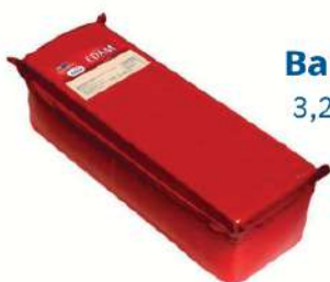
Barra edam 3,2 kgs aprox