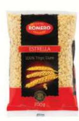
Pasta estrellas B/ 5 kg.