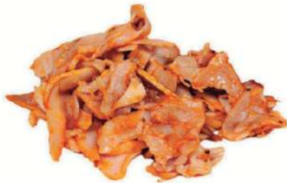
Kebab pollo cortado