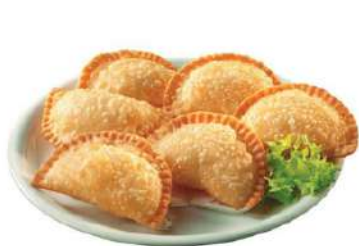
Empanadilla atún clavo