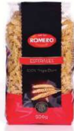
Pasta espirales B/ 5 kg.