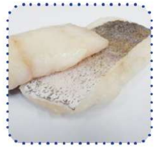
Suprema merluza austral