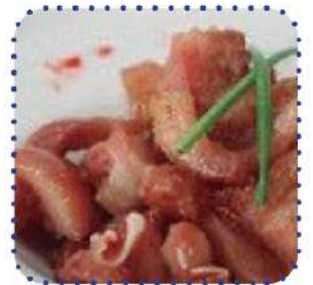
Morro cocido troc. Adob.