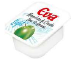
Mermelada porc. ciruela C/ 80x20 gr.