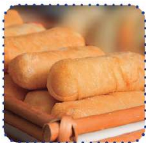
Tequeños queso blanco