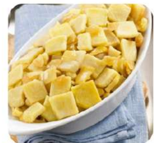
Base tort. Patata y ceb.