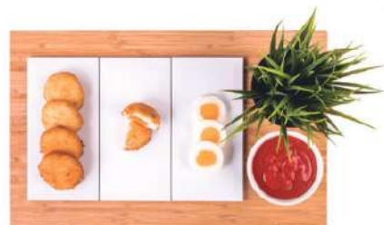
Huevos con bechamel