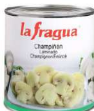
Champiñon laminado C/ 6x3 kg.