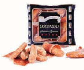
Picos gourmet rústicos C/ 100x20 gr.