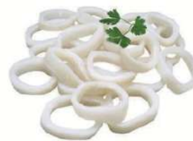
Anilla pota Pacífico