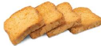
Mini biscotes normales C/ 18x60 und.