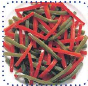
Duo pimientos rojo y verde