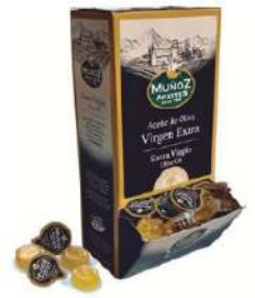
Aceite V.E. C/ 168x10 ml