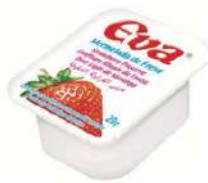
Mermelada porc. fresa C/ 80x20 gr.