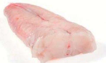
Cola rape 200-300