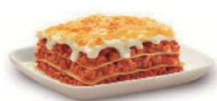
Lasaña gratinada carne