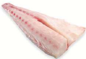
Filete corvina c/p 1000-up